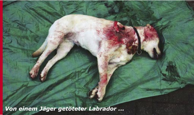
Von einem Jäger getöteter Labrador ...

Wussten Sie in diesem Zusammenhang, dass in Deutschland jährlich ca. 300.000 Katzen und ungefähr 30.000 Hunde von Jägern unter diesem Vorwand abgeschossen werden?